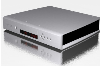
Revo CDP-1 Reproductor CD (Novedad)